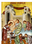
Le lavement des pieds (cf. Jn 13, 13-15)