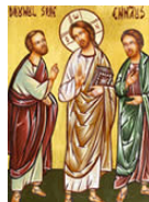
Le récit des disciples d'Emmaüs (cf. Lc 24, 13-35)