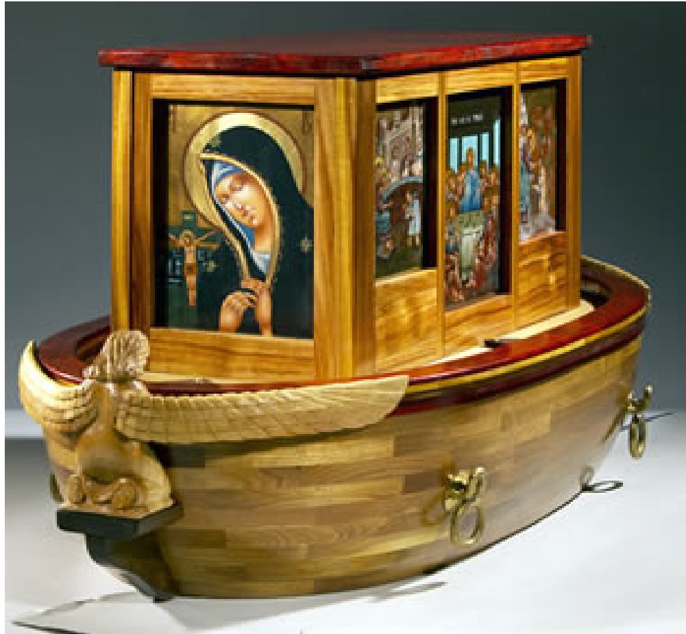
Arche de la Nouvelle Alliance