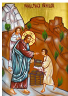
Le récit de la multiplication des pains (cf. Mt 14, 19-21; 15, 36-37)

Quatre autres icônes de format plus petit rappellent l'Eucharistie, table de la nouvelle Alliance, sous différents aspects :