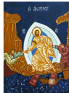
La résurrection de Jésus au matin de Pâques, célébrée le dimanche de Pâques

Quatre autres icônes de format plus petit rappellent l'Eucharistie, table de la nouvelle Alliance, sous différents aspects :