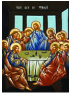
La Dernière Cène dont l'Église fait mémoire le Jeudi saint

Au niveau supérieur de l'Arche de la Nouvelle Alliance, quatre icônes de format plus grand représentent les divers moments du Mystère pascal :